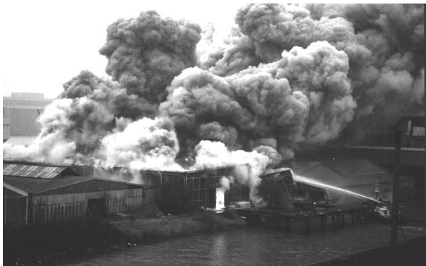
De CMI-brand op 28 februari 1996.

Naast historisch materiaal over de brand bevat de voorstelling verwijzingen naar het bedrijf van de alchemist, waarin 'het chemische huwelijk', de verbinding van het vrouwelijke en het mannelijke element, het centrale beeld is.