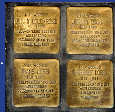
De vier struikelstenen voor de joodse familie Loeb, die Gunter Demnig in 2010 plaatste voor de ingang van boekhandel de Kler aan de Breetstraat 161 in Leiden. <

De vijf struikelstenen zullen worden geplaatst voor een huis in de Kloksteeg. Daar woonde ooit de joodse bakersfamilie Weijl . In de Tweede Wereldoorlog werden vijf van de zes gezinsleden door de nazi's opgepakt, weggevoerd en vergast. De struikelstenen waarschuwen ons dat we het in ónze tijd niet mogen toestaan dat gruweldaden als die van de nazi's zich waar dan ook herhalen.